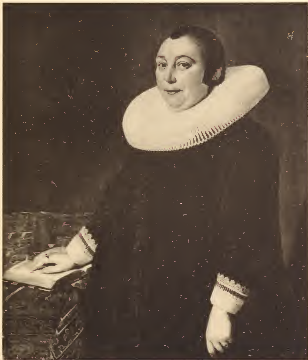
vente le 23 fevrier 1904, Dir. Frederik Muller & Cie. (Ant. W. M. Meusing).